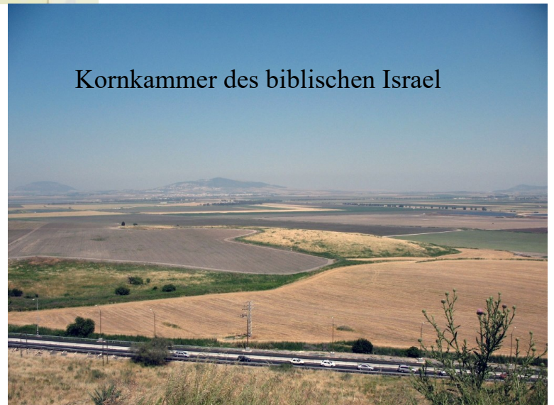
Kornkammer des biblischen Israel