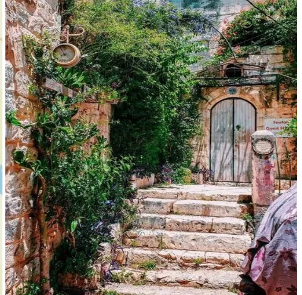
Berg der Versuchung